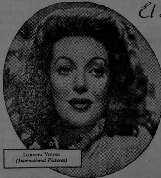
LORETTA YOUNG (International Pictures)

La mayor parte de sus estrellas favoritas emplean Jabón Lux de Tocador para el cuidado de su aterciopelado cutis—y entre ellas figura también la encantadora Loretta Young.