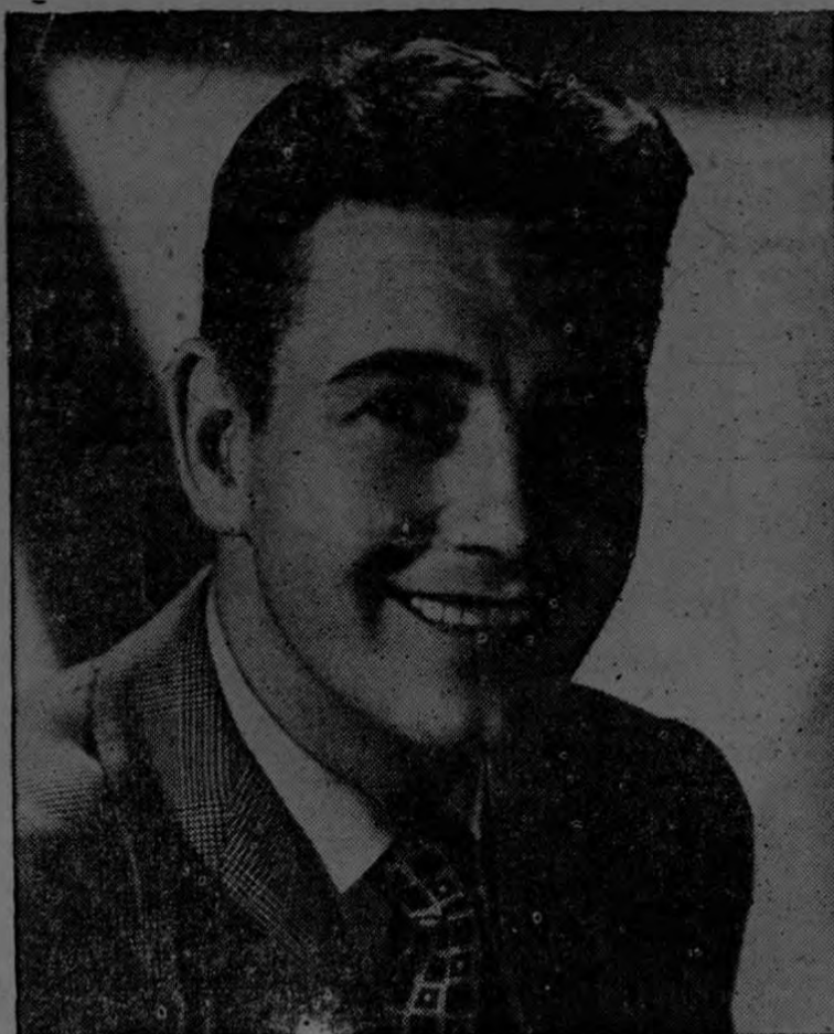
Tom Drake, Actor de la Metro Goldwyn Mayer

Tom Drake es un joven que irremisiblemente cae simpático por su manera juvenil, despreocupada y natural de ser. Su cautivadora sencillez y extremada sinceridad han sido factores importantes para su éxito en la pantalla.